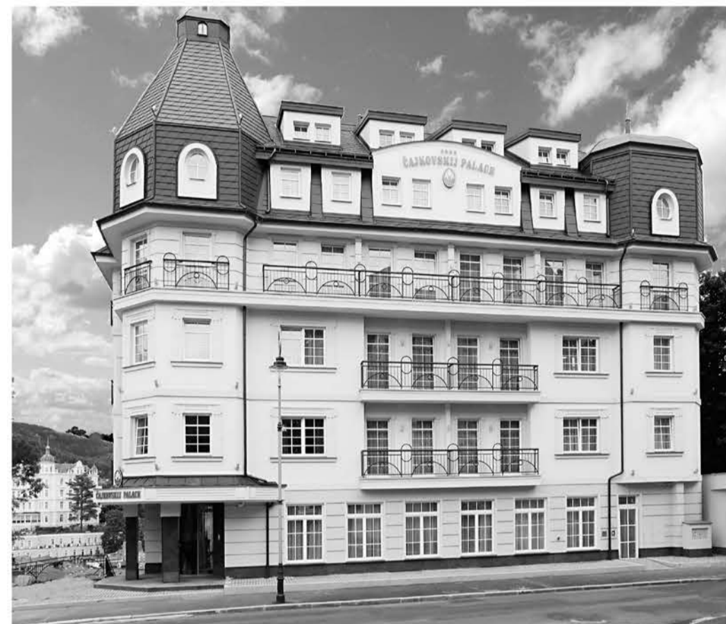
KARLOVARSKÝ Spa & Wellness Hotel Čajkovskij Palace.